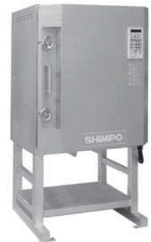
マイコン付小型電気窯