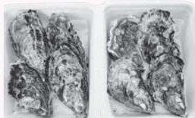
大きく 粒のそろった 「ひとつぶくん」