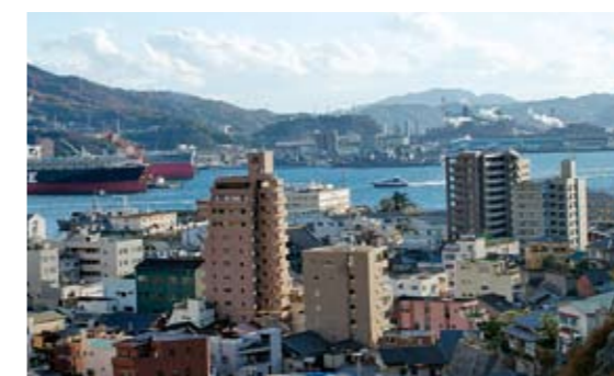
両城地区から 呉湾を臨む