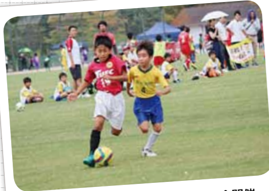
第22回 くれしんU-12サッカー大会開催 (平成28年9月3日・4日)