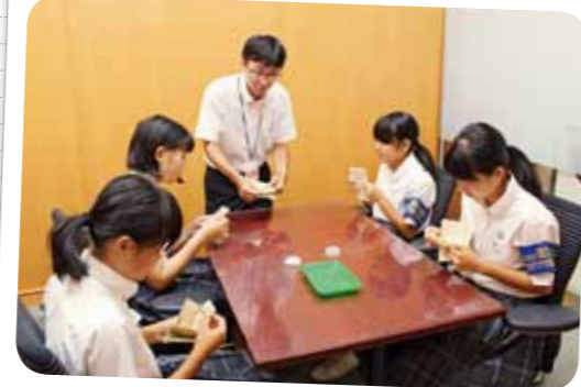
中学生職場体験学習生の受け入れ (平成28年8月22日~26日)