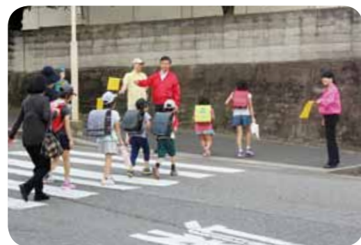
交通安全街頭活動 (平成28年6月15日)