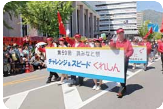
第59回呉みなと祭パレードに参加 (平成28年4月29日)