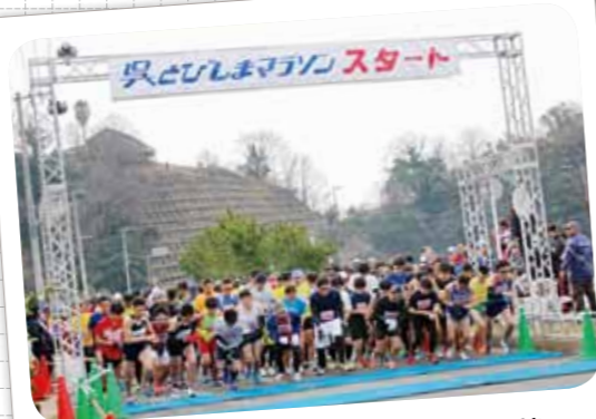
第8回 呉とびしまマラソン大会に協賛 (平成29年2月26日)