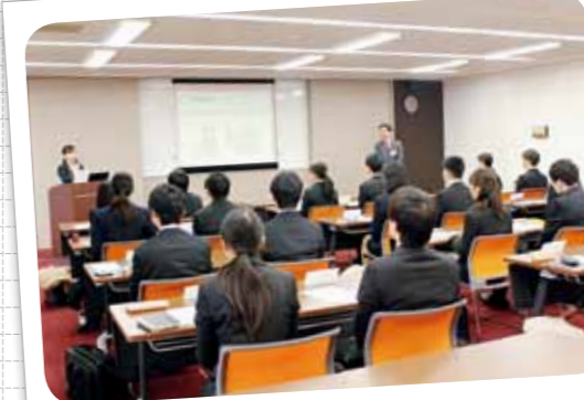
インターンシップ研修生受け入れ (平成29年2月14日)