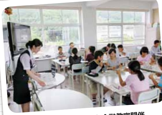
天応小学校でくれしん金融教室開催 (平成28年6月15日/15校22教室で開催)