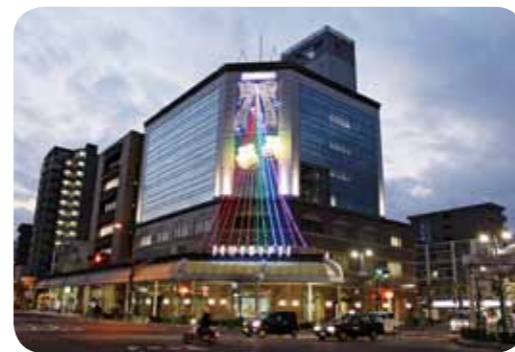
本店本館壁面にイルミネーション設置 (平成28年11月22日)