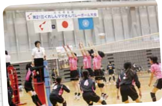
第21回 くれしんママさんバレーボール大会開催 (平成28年5月21日・22日)