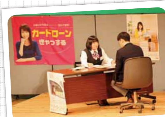
第36回 中国地区信用金庫 ロールプレイング大会で優勝 (平成29年2月4日)