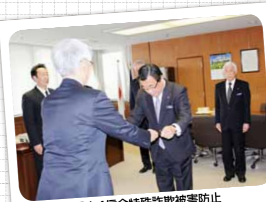
県内4信金特殊詐欺被害防止 ATM振込制限に対して感謝状授与 (平成29年3月21日)