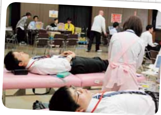
献血への協力 (平成28年4月6日)