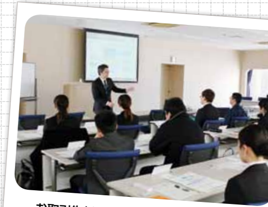
お取引先新入社員のための接遇研修開催 (平成29年3月23日)