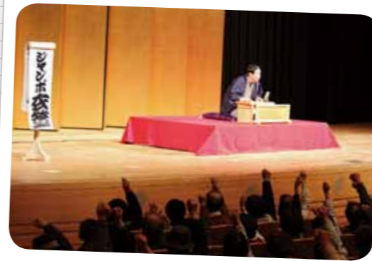
第19回 くれしん笑芸会爆笑寄席開催 (平成29年1月14日)