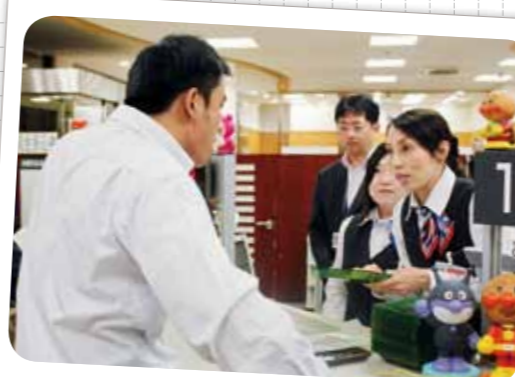
反社会的勢力対応窓口訓練実施 (平成28年10月21日)