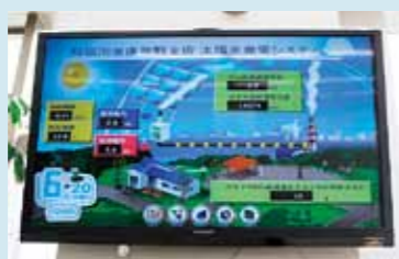
太陽光発電システム