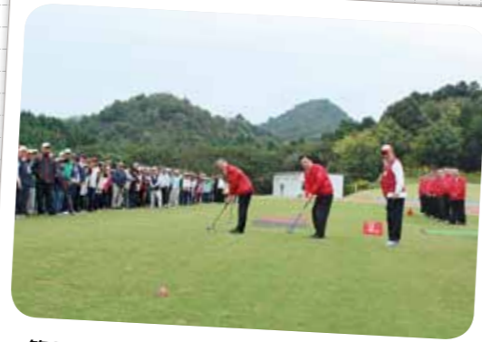
第6回 くれしんグラウンド・ゴルフ大会開催 (平成28年10月21日)