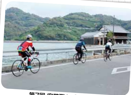
第7回 安芸灘とびしま海道 オレンジライド2016に協賛 (平成28年11月20日)