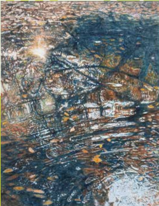
第7回グランプリ作品「波紋」