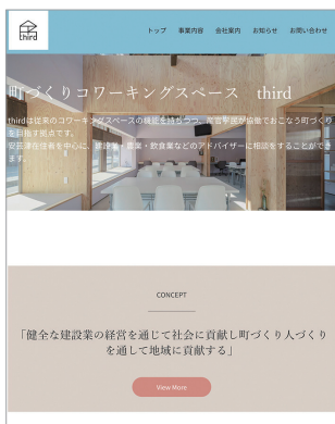
株式会社新川のホームページ画面。

先日、thirdを利用いただいていた地元住民の方が、クレープ屋を開業されました。経営経験や人脈がないことに悩んでおられたため、地元の先輩経営者をお繋ぎし、アドバイスを頂くことで事業の開始に繋げることができたと感謝いただきました。今後もthirdのPRを通じて「繋げる活動」に取り組みしていきたいです。